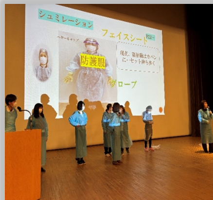
防護服等を用いての実技